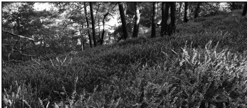
Vřesový koberec na Pani skále pod Vřesníkem

Když nebudeme chodit daleko od Humpolce, dojdeme do míst, krásných a proslulých