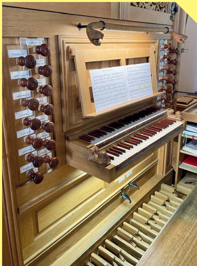
Varhany v kostele svatého Mikuláše jsou pro Lukáše Dvořáka srdcovou záležitostí.