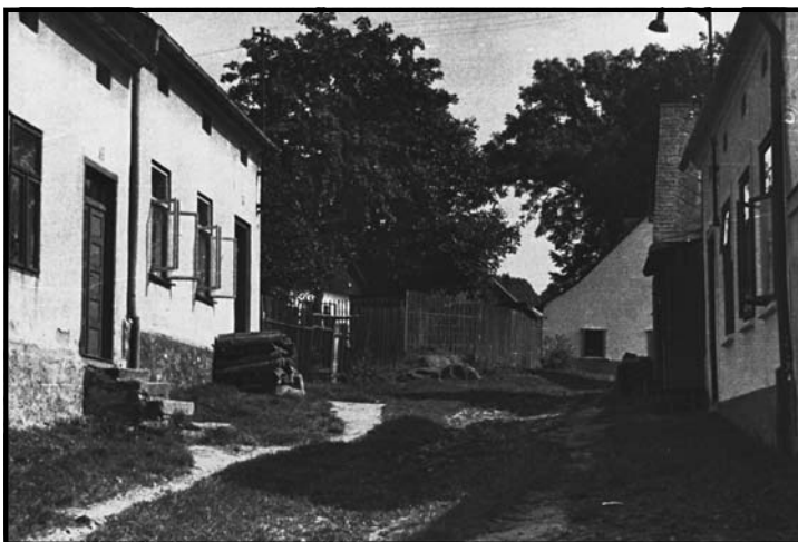
vlevo domek čp. 574, nad ním čp. 342, naproti vpravo dole stavení čp. 341 a nad ním čp. 340