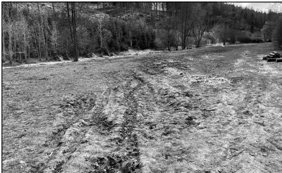
Tady za dva měsíce bude stát tábor.