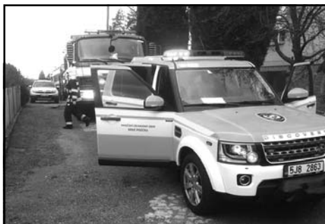
Foto vlevo Patrik Kalenda při požáru lesa Čejov-Leštína, druhé foto z příjezdu jednotek k požáru uskladněného uhlí v RD v Koberovicích.