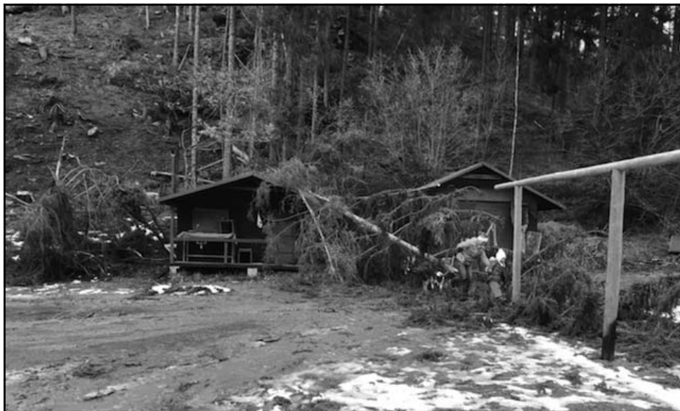
Takto to dopadá, když se větru otevře cesta do lesa...

Loni touto dobou jsme ještě neznali stav, kdy doněkonečna prodlužovaný lock-down obchodu, služeb, kultury a sportu, zákaz pohybu mezi okresy, uzavření škol a zákaz organizovaných volnočasových či spolkových