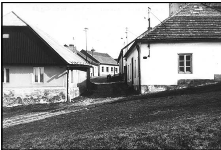
v popředí vlevo stavení čp. 374, za ním čp. 349, čp. 347, dále čp. 345.