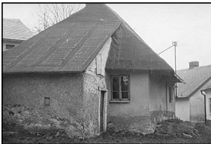
níže pod uličkou stavení čp. 343