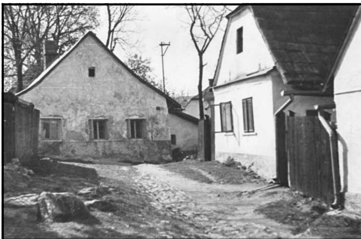
stavení čp. 338, vpravo čp. 339, níže čp. 340