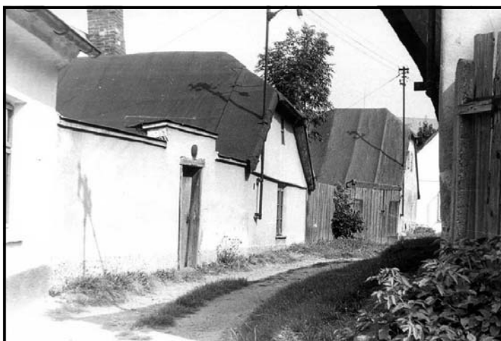
stavení čp. 346 (spojeno pak se stavením čp. 347) a čp. 348 (spojeno se stavením čp. 349)