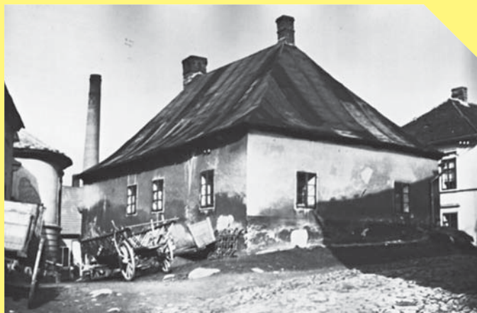
rodný dům Filipa Reinera v Humpolci