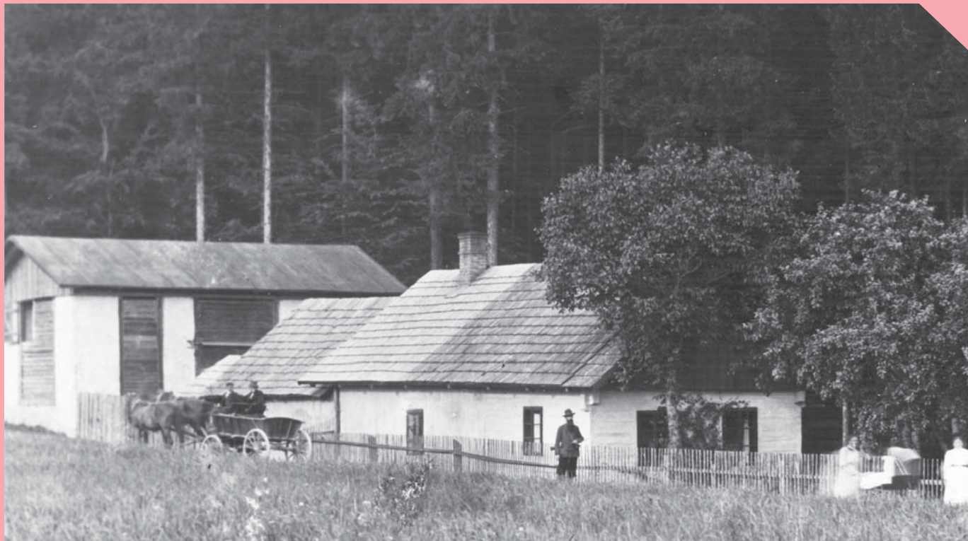
městská hájovna na historické fotografii