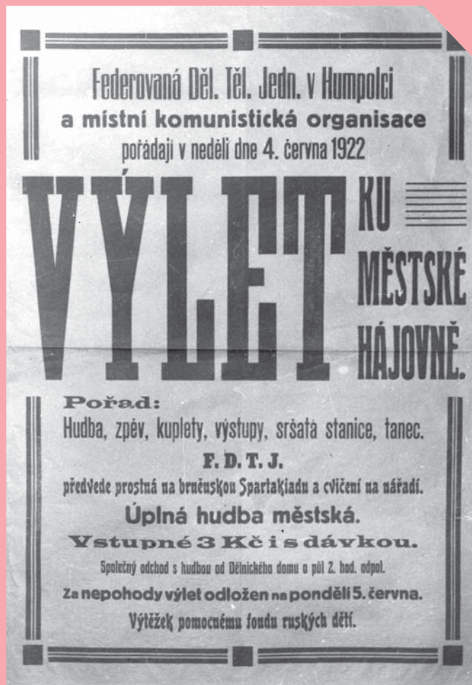
fotokopie plakátu ze 4. června 1922

KOMENTÁŘ: Na počátku 20. století byla městská hájovna, nacházející se na křižovatce jihlavské silnice s odbočkou na Bystrou, častým cílem výletů. Svědčí o tom vysoký počet plakátů zvoucích k procházce k hájovně uložených ve zdejším muzeu včetně toho, který patří ke zmiňovanému výletu. I v současné době je městská hájovna důležitým orientačním bodem při nejrůznějších akcích mimo město. Na jaře naváže na tuto více než stoletou tradici také muzeum svou muzejní vycházkou.