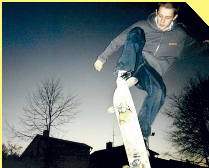
Skateboarding na hřišti na házené

více než 17 letech. Z výstavy se dozvíte o historii skateboardingu, jehož počátky sahají do padesátých let.