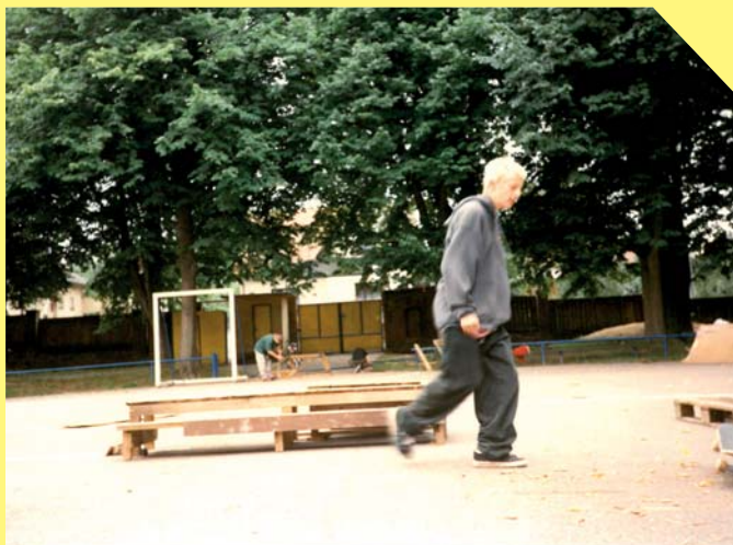
Skateboarding na hřišti na házené