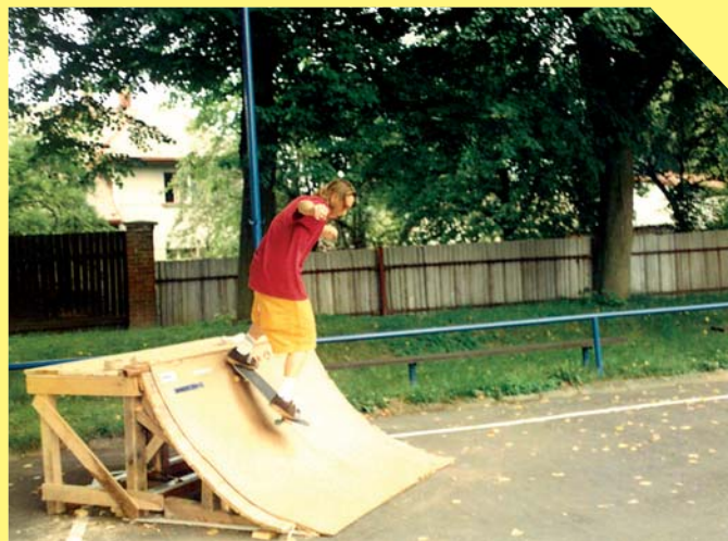
Skateboarding na hřišti na házené