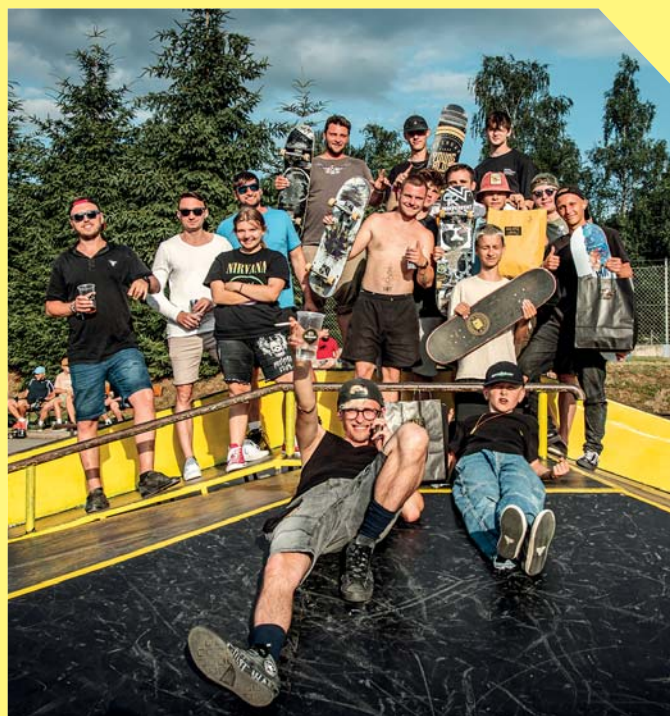
Závody Skate and Sound 2023