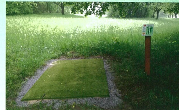
Výhoziště. Odsud vždy vychází první hod na koš.

Hřiště Discgolf Podhrad se skládá z devíti jamek, které jsou tvořeny ocelovými koši s řetězy. Každá jamka má svůj PAR, tzn. "optimální" počet hodů, kterými by měl hráč dopravit disk z výhoziště do koše. Celkový PAR hřiště je součtem parů jednotlivých jamek. Za každý hod nad PAR jamky se hráči připočítává jeden trestný hod, za každý hod pod par jamky se naopak bod odečítá. Vítězem se stává hráč, který celé hřiště zahraje s nejmenším počtem hodů.