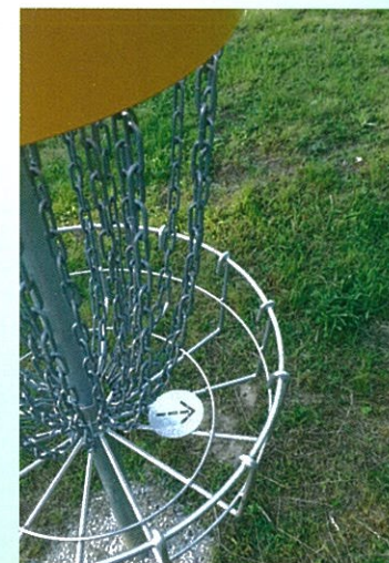
Šipka v koši směřuje k dalšímu výhozišti.

DISC GOLF je zábavná, fyzicky nenáročná aktivita, kterou může provozovat opravdu každý. Je vhodný pro rodiny s dětmi, pro partičky puberťáků, pro dospěláky i pro seniory. Stačí si vzít s sebou disky (létající talíře) a vyrazit do lesoparku pod Orlíkem. Můžete trénovat sami, ale daleko zábavnější je zkusit hru ve skupince. Projdete se, než objednáte všech devět košů, nachodíte cca 3 km, popovídáte si a poměříte své síly, důvtip a obratnost. Když přibalíte s sebou do batůžku i občerstvení, váš výlet za discgolfem nebude mít chybu!