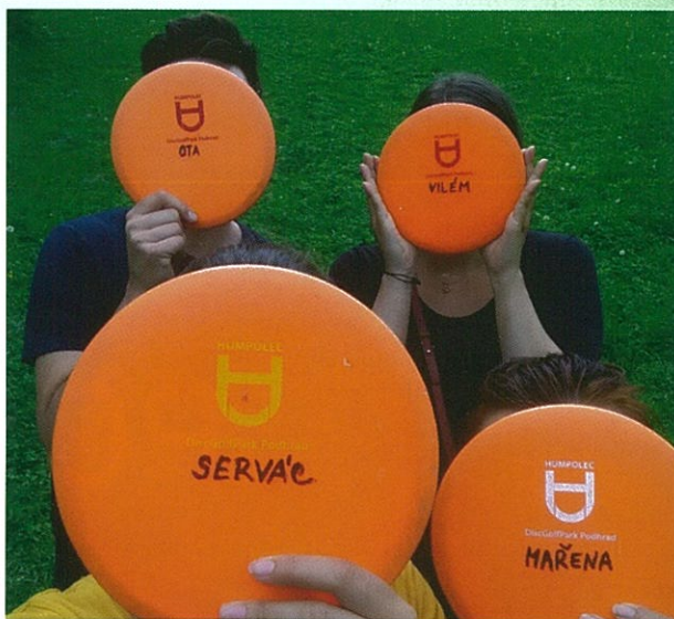
Je důležité, aby každý hráč měl svůj disk.

Disky si můžete půjčit v infocentru Humpolec za vratnou kauci 300 Kč/kš. Až disky vrátíte, dostanete svoji kauci zpět.